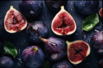
Fig & Lychee

Cały zapach brownie jest nasycony, ciężki i aromatyczny. To zapach, który wzbudza poczucie przyjemności i komfortu, przypominając o chwilach słodkiego rozkoszowania się. Jest to aromat, który kojarzy się z przytulnymi wieczorami, spotkaniami z przyjaciółmi i nieodłącznymi słodkimi przyjemnościami.