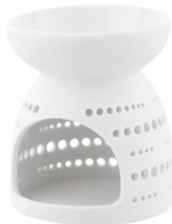
AROMA COMFORT small