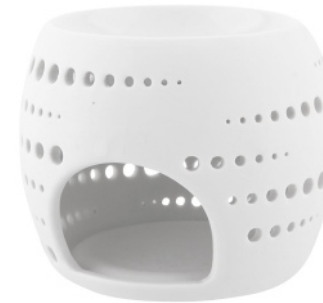
AROMA COMFORT big