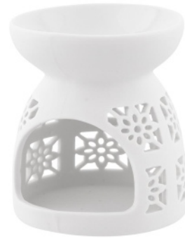
AROMA CHIMNEY small