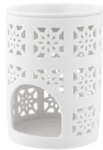
AROMA CHIMNEY big

Pragniesz stworzyć w swoim domu przytulną i relaksującą atmosferę? Skorzystaj z naszych kominków zapachowych! Nasze kominki zapachowe to idealne rozwiązanie dla tych, którzy chcą cieszyć się ciepłym i przyjemnym zapachem w swoim domu. Wystarczy dodać 2-3 kostki ulubionej tabliczki zapachowej z naszej oferty a Twój dom wypełni się aromatem Twojego wyboru.